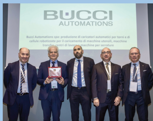
Sopra, le due imprese associate da 60 anni, sotto le tre aziende associate da 50 anni