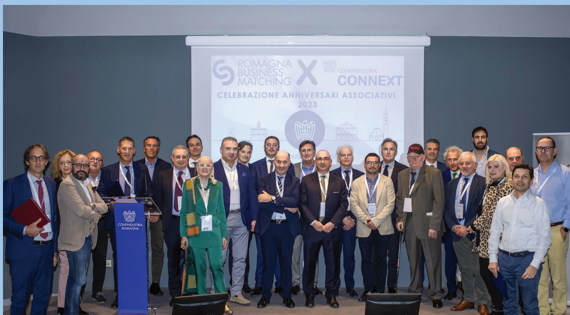
Foto di gruppo per imprenditrici e imprenditori che hanno aderito al sistema confindustriale negli anni 1963, 1973, 1983, 1993 e 2003