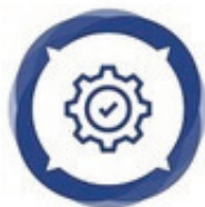
GENERAL MANAGEMENT TEAM